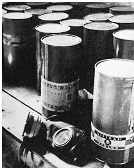
Figure 4: Boîtes de zyklon B de 1.5 kg avec un masque trouvés à Majdanek après la libération du camp

En admettant que ce qu'il dit soit exact, les SS se souciaient-ils réellement des personnes qui pénétraient les premières dans les chambres après un gazage, à savoir, des détenus du camp. En réalité, comme les chambres à gaz étaient équipées d'un système de ventilation et qu'elles n'étaient composées que de quatre murs nus, le temps de 15 à 20 minutes d'attente était suffisant avant d'y pénétrer. Il ne faut pas oublier que les Allemands avaient de grandes connaissances et beaucoup d'expérience avec le Zyklon B. Ils l'utilisaient donc avec précaution (emploi de papier indicateur pH 34 ...).